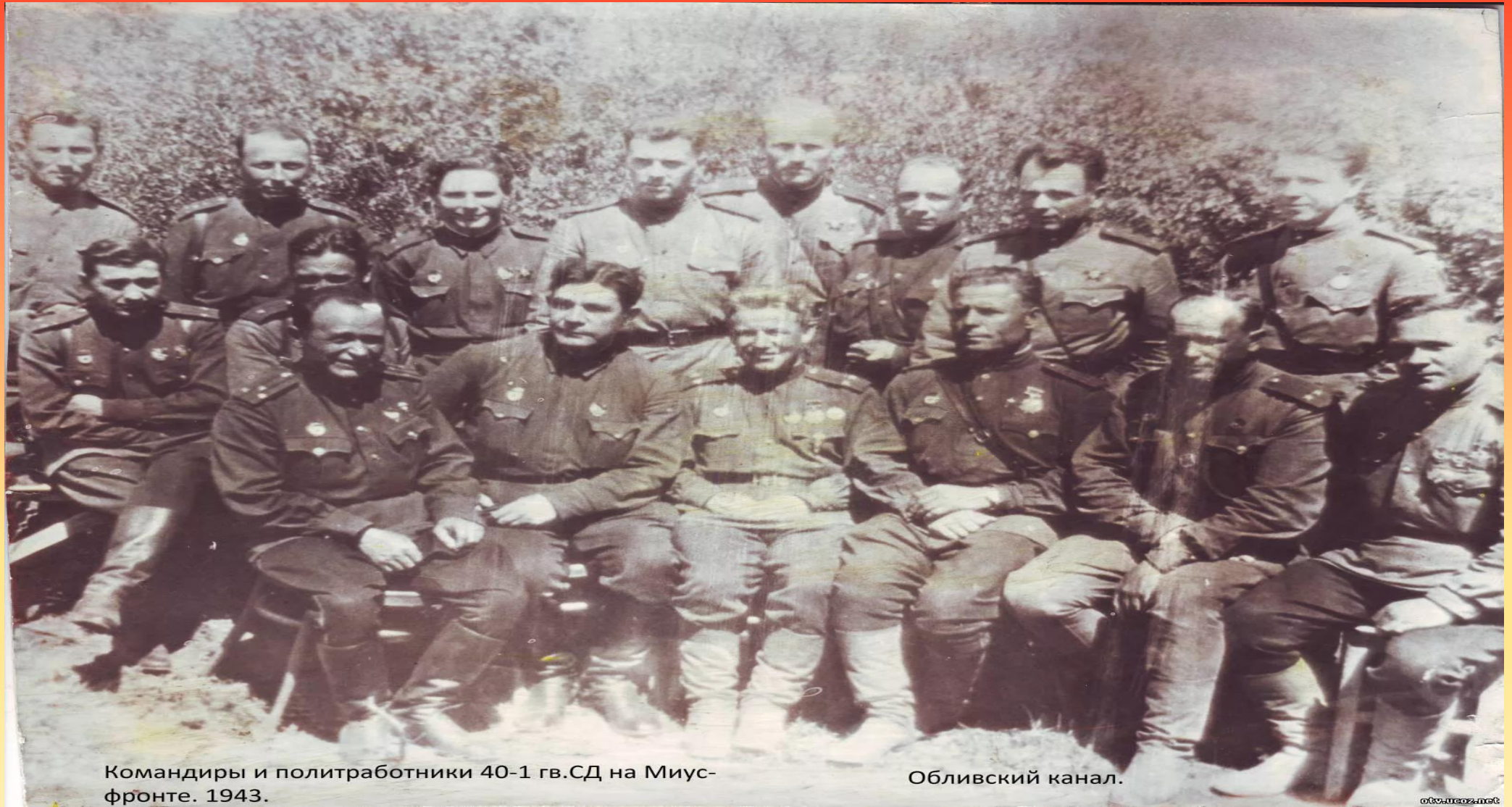
Командиры и политработники 40-1 гв.СД на Миус-фронте. 1943.