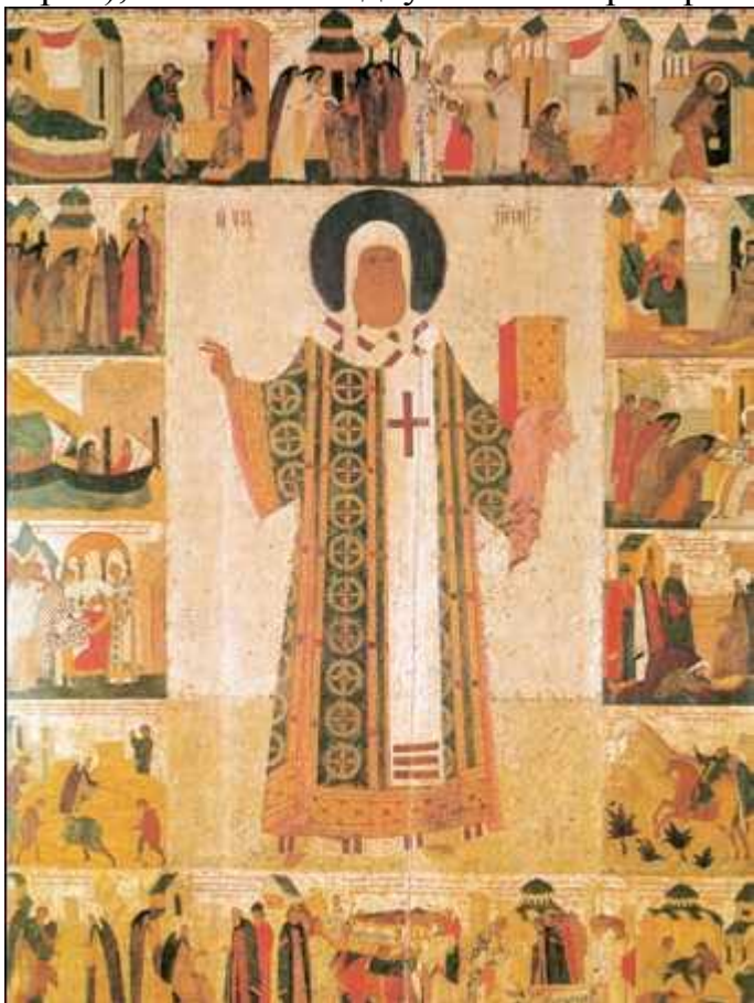
Дионисий. «Св. Пётр Митрополит с житием». Икона. Ок. 1481 г. Успенский собор Московского Кремля

жённые в глубокую синеву, вырваны из плена земного притяжения; все линии, силуэты, движения устремлены ввысь. Каждая сцена – торжественное, возвышенное, полностью очищенное от обыденности действо. Сюжеты разворачиваются на стенах по мере движения вошедшего в храм от входа к алтарю, от «Страшного суда» в западной части до композиций, звучащих радостным гимном Богородице («Покров», «О Тебе радуется», «Собор Богоматери»), в светлом подкупольном пространстве.