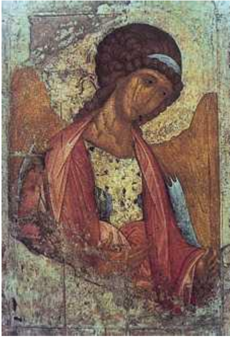
Андрей Рублёв. «Архангел Михаил». Икона из «Звенигородского чина». Ок. 1394 г. Государственная Третьяковская галерея. Москва