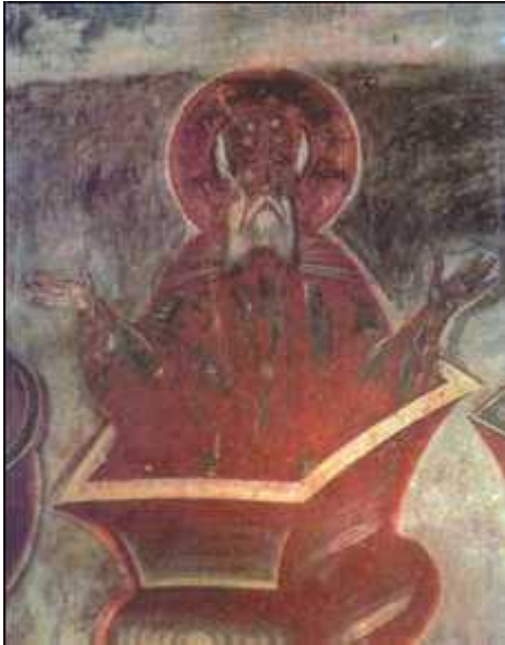
Феофан Грек. «Столпник Симеон Старший». Фреска. 1378 г. Церковь Спаса Преображения на Ильине улице. Новгород. Фрагмент