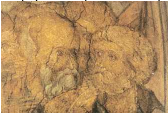
Андрей Рублёв. «Шествие праведных». Фреска. 1408 г. Успенский собор. Владимир. Фрагмент

Первое упоминание в летописи о чернце (монахе) Андрее Рублёве относится к 1405 г., когда он вместе со старшими мастерами – Феофаном Греком и Прохором с Городца – писал иконы и фрески для Благовещенского собора Московского Кремля. В мае 1408 г. Андрей Рублёв и «иконник Даниил» (известен как Даниил Чёрный) были направлены во Владимир для украшения Успенского собора. Сохранилось несколько созданных там икон и фрагменты фресок. Перед мастерами стояла сложная задача – расписать криволинейные поверхности сводов и арок сценами Страшного суда. В центре композиции – Христос-Судия на троне в ореоле небесной славы, к которому устремлён весь окружающий мир. «Страшный суд» Андрея Рублёва и Даниила Чёрного внушает не страх и трепет, а веру в торжество добра, милосердия и справедливости, в грядущую великую радость, выстраданную всем существованием человечества. Образ Христа величав и светел, спокойны беседы апостолов и лучатся счастьем взоры шествующих на небо праведников.