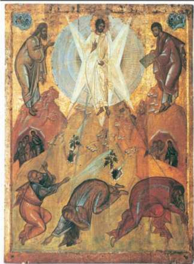
Мастер круга Феофана Грека. «Преображение». Икона. Нач. 15 в. Государственная Третьяковская галерея. Москва

Пространство храма Феофан трактует как место Богоявления. Центральный медальон купола с поясным изображением Христа Пантократора (Вседержителя) окружён строкой из псалма: «Господь с небеси на землю призри». Взор Спасителя, являющегося людям во всём своём грозном величии, озаряет храм, подобно вспышке молнии, потоком благодатного света. Христос окружён фигурами архангелов, огненных херувимов и серафимов и – ниже – фигурами ветхозаветных праведников и пророков. Всё человечество предстоит перед Христом в мистическом единении с Богом, пронизавшим храм-Вселенную лучами очистительного Божественного света. Росписи в нижней части храма сохранились хуже, но и фрагменты – фигуры святых отшельников, мучеников, воинов, сцены из Священной истории позволяют почувствовать атмосферу благоговения, трепетной молитвы, глубочайшего духовного потрясения от грандиозного явления Спасителя. Кисть Феофана стремительна, энергичные мазки чередуются с лёгкими прорисовками тканей. Фигуры и лики словно выхвачены светом из мрака небытия.