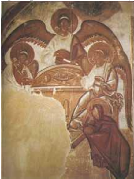
Феофан Грек. «Троица Ветхозаветная». Фреска. 1378 г. Церковь Спаса Преображения на Ильине улице. Новгород