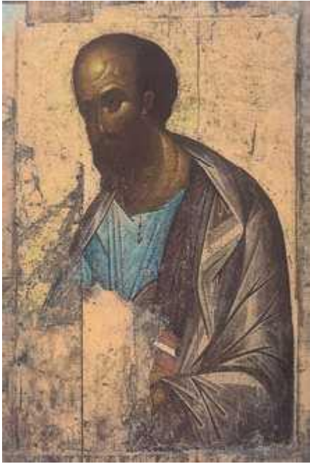
Андрей Рублёв. «Апостол Павел». Икона из «Звенигородского чина». Ок. 1394 г. Государственная Третьяковская галерея. Москва