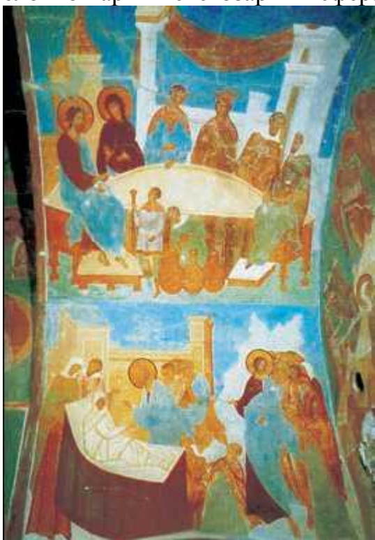
Дионисий. Фрески Ферапонтова монастыря. 1502—03 гг. Вологодская область

Иконы Дионисия, сияющие светлыми, торжественными белыми, золотыми, красными красками, пронизаны ликующей радостью. Даже «Распятие» (ок. 1500 г.) не передаёт трагедию умирающего на кресте Спасителя, а утверждает победу жизни над смертью. Житийные иконы мастера и его учеников давали зримые образы человеческой жизни как пути духовного совершенствования («Митрополит Пётр с житием», «Митрополит Алексей с житием»; обе – ок. 1481 г.). Фигуры московских митрополитов возвышаются посреди преображённого их трудами и молитвами благостного и несуетного мира. Прославление именно отечественных святых подвижников и основателей монастырей («Прп. Кирилл Белозерский», рубеж 15–16 вв.) отвечало идее укрепления русской церкви и русской государственности. В житийных сценах представлены не только сотворённые ими чудеса, но и деяния во благо государства, переговоры с князьями, поездки в Орду, возведение соборов. В фигурах митрополитов мастер подчёркивает «ангелоподобность», удлиняя их пропорции, замедляя ритм движений. Невесомые, почти бесплотные фигуры, словно парят в светозарных сферах.