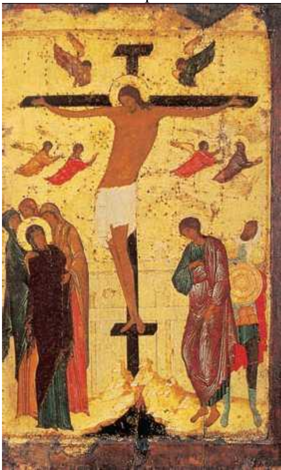
Дионисий. «Распятие». Икона. Ок. 1500 г. Государственная Третьяковская галерея. Москва

(ок. 1440 – после 1503), русский иконописец, мастер фрески; представитель московской школы живописи, продолжатель традиций Андрея Рублёва. Предположительно, учился в мастерской при московском Симоновом монастыре под руководством старца Митрофана, совместно с которым расписал собор Рождества Богородицы в Пафнутьево-Боровском монастыре (между 1467 и 1476 г.). Искусство Дионисия формировалось в столичной учёной «книжной» среде. Творчество иконописца было высоко оценено современниками, в том числе Иваном III. Мастеру заказывали работы архиепископ Ростовский Вассиан Рыло, духовник Ивана III (иконостас Успенского собора Московского Кремля, 1481); архиепископ Иоасаф Оболенский (росписи собора Ферапонтова монастыря, 1502—03); богослов Иосиф Волоцкий (росписи и иконы Иосифо-Волоколамского монастыря, после 1485 г.). В кругу этих крупных церковных деятелей разрабатывалось представление о государстве как о некоем идеальном организме, где царствуют духовные ценности, нестяжательство и красота.