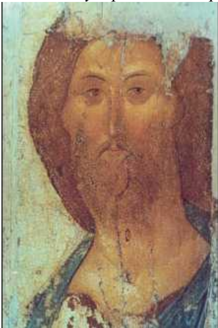
Андрей Рублёв. «Спас». Икона из «Звенигородского чина». Ок. 1394 г. Государственная Третьяковская галерея. Москва