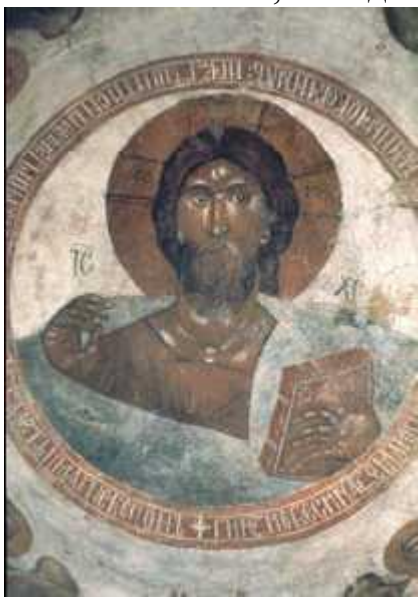
Феофан Грек. «Христос Пантократор». Фреска. 1378 г. Церковь Спаса Преображения на Ильине улице. Новгород

На Русь художник приехал не позднее 1378 г. Сохранилась копия ктиторской (ктитор – церковный староста) надписи, согласно которой он расписал в этом году церковь Спаса Преображения на Ильине улице в Новгороде. Эти росписи частично сохранились и стали надёжным источником для изучения творческого почерка мастера. В это время в Новгороде ещё сохранялась атмосфера вольности, активно обсуждались религиозные вопросы; духовное брожение в обществе выразилось в возникновении еретических учений, особенно влиятельным было движение стригольников, отрицавших церковную структуру и основные христианские догматы. В ответ активно выступали церковные круги, появлялось множество богословских трудов, ширилось церковное строительство. В этой обстановке сыграло исключительно важную роль искусство Феофана Грека, вдохновлённое «исихазмом» (от греч. hesychia – покой, безмолвие) – византийским аскетическим учением о пути человека к единению с Богом через «очищение сердца», «попаление» (сожжение) греховных страстей, достижение благодати через приятие нетварного (Божественного) света. Свет выступает в произведениях этого времени не только как эстетическая, но и догматическая категория.