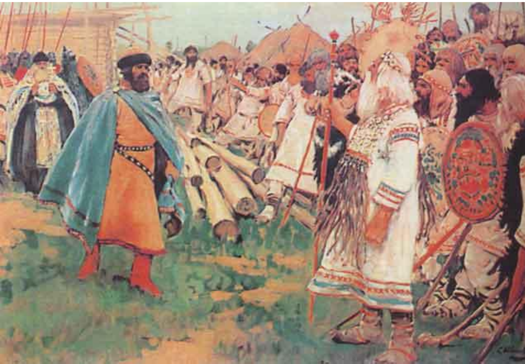
«Христиане и язычники». Иванов С.

Но были случаи ожесточенных столкновений язычников с княжеской дружиной.