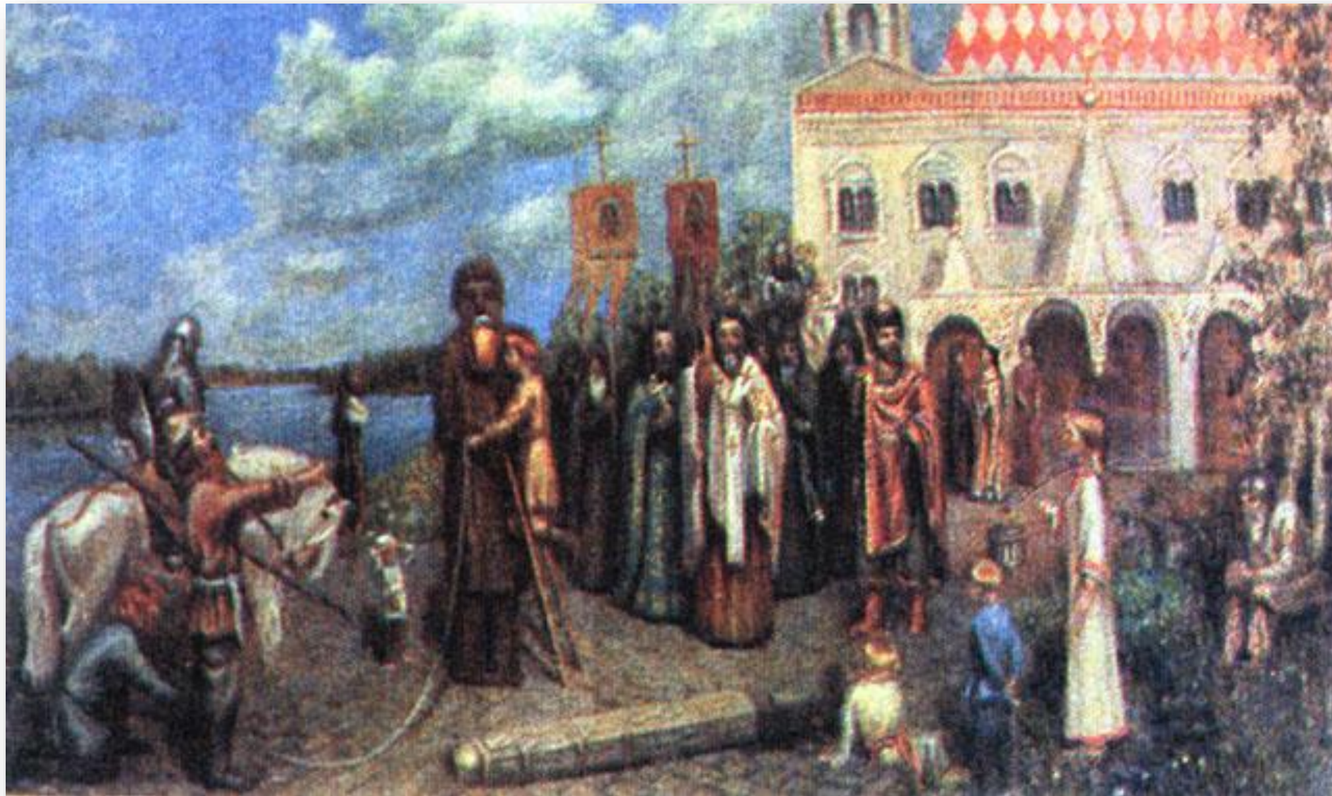
«Свержение идола Перуна». Макаров М.

Вернувшись домой в Киев, приказал опрокинуть языческих идолов.