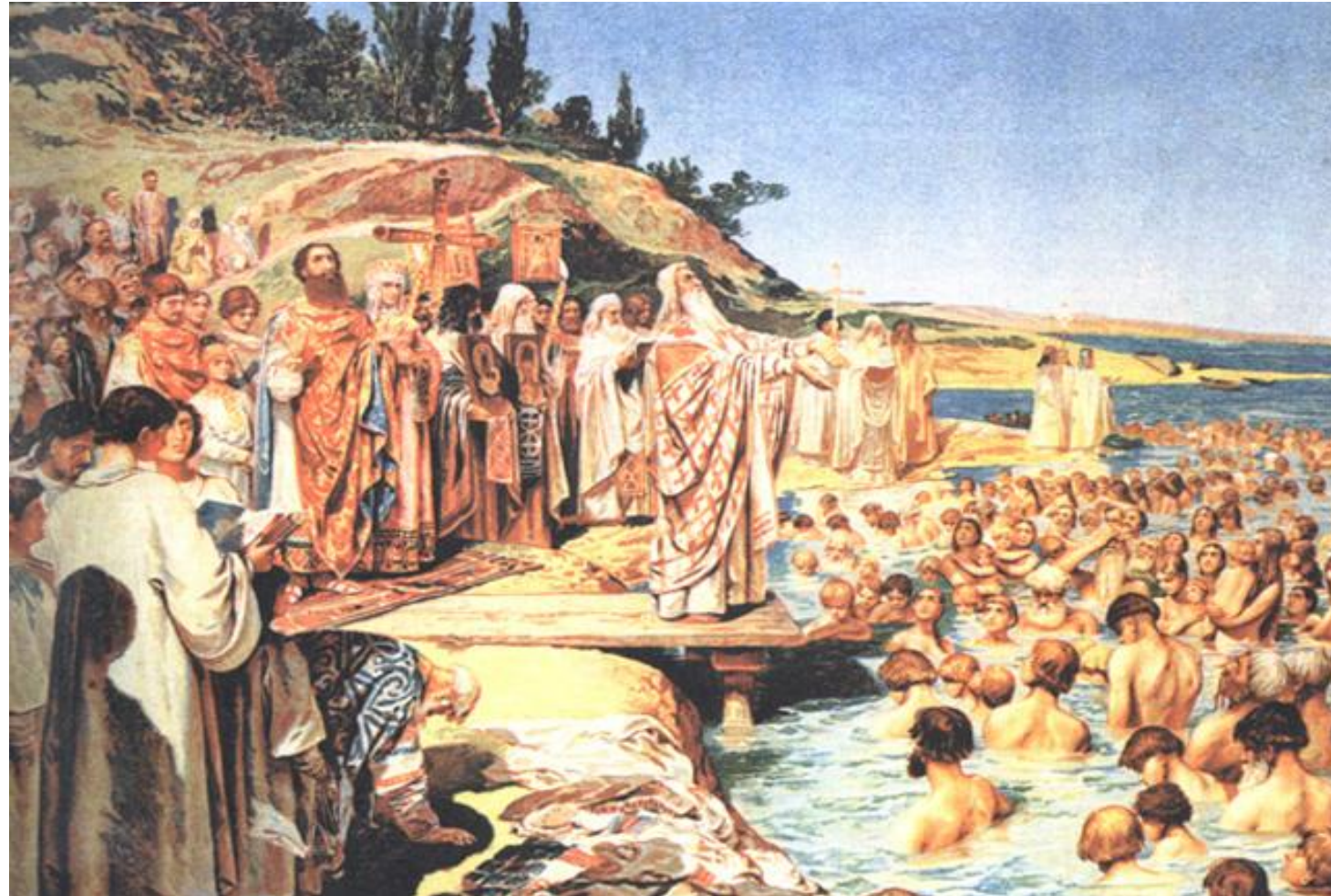
«Крещение киевлян». Лебедев К.

На следующее утро Владимир приказал всем киевлянам явиться к реке, где был совершен обряд крещения (р. Днепр = Пучай-река в ПВЛ).