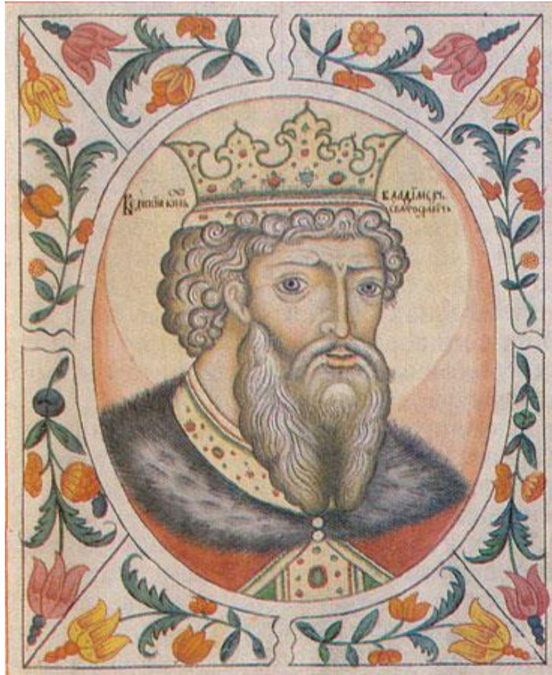
Великий князь Владимир Святославич. Неизв. автор.

Вместо далёких походов Владимир главное внимание сосредоточил на организации обороны и сплочении огромной державы под своей властью.