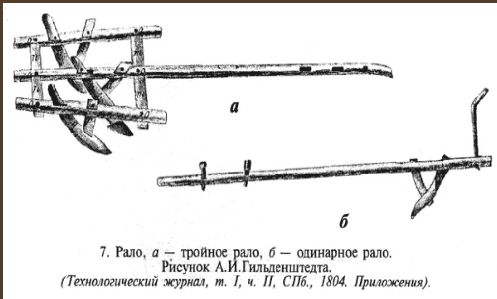
7. Рало, a — тройное рало, б — одинарное рало.